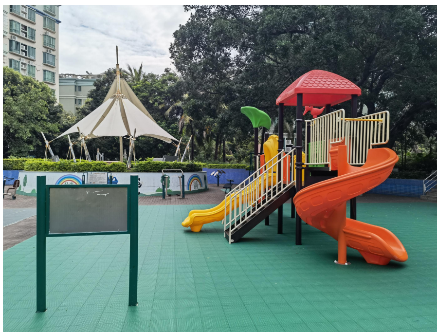
南村豪苑户外儿童活动场地

二是借力更新，衔接城市重点工作完善社区儿童设施。社区内有五个居住小区，均在 2000 年前后建成，项目利用老旧小区改造契机，在改造中融入儿童元素，加入适儿化改造项目，逐步解决了社区儿童设施不足、设施老化的问题。