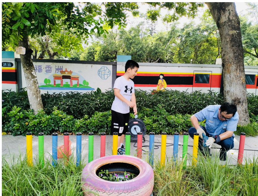
儿童参与改造施工过程

二是借力更新，衔接城市重点工作完善社区儿童设施。社区内有五个居住小区，均在 2000 年前后建成，项目利用老旧小区改造契机，在改造中融入儿童元素，加入适儿化改造项目，逐步解决了社区儿童设施不足、设施老化的问题。