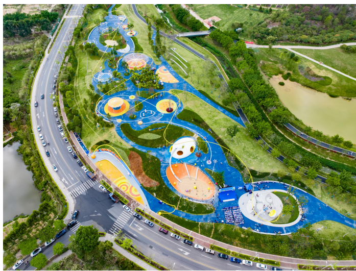
松山湖儿童友好中子乐园全景图

东莞市把儿童友好空间建设作为促进“百千万工程”的重要切口，立足“科技创新+先进制造”城市特色，依托松山湖国家高新区（科学城），在国家“五个友好”基础上增加“科技创新友好”，在全省率先开展儿童友好科创园区建设。2024年3月，松山湖正式发布《东莞松山湖儿童友好科创园区创建指引》，作为“公园绿地科创儿童友好”重要举措之一的松山湖儿童友好中子乐园建成启用。该乐园面积约3.4万平方米，以国家“十二五”期间重点建设的十二大科学装置之首—中国散裂中子源作为场地主题灵感来源。