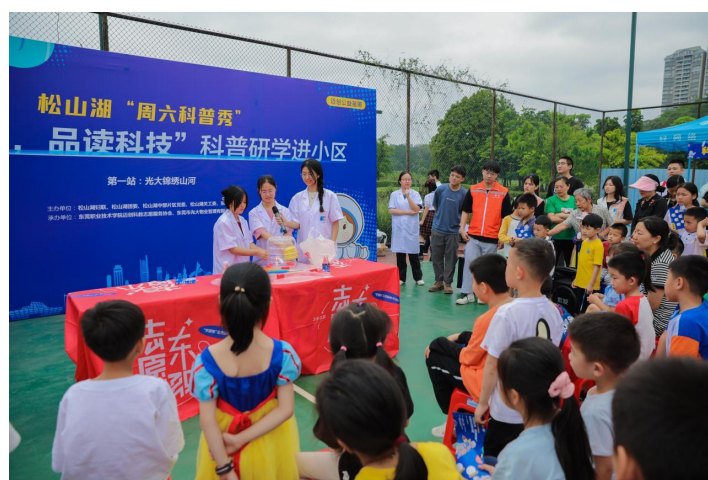
松山湖周六科普秀

三是打造特色科普教育品牌，点燃青少年科技强国梦。坚持以“青少年科学素质提升行动”为主、“品牌科普活动打造和科普阵地共建”为辅，接连推出“周六科普秀”“科学北斗”“行走课堂”“多彩课堂”等一系列科普品牌，通过科学实验、科普讲座等方式，让孩子们周末不仅有新去处，对科学的兴趣和与探索未知事物的热情也日渐昂扬。