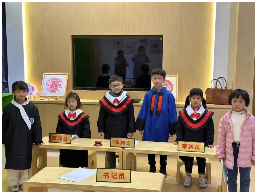
“海邻学堂”——儿童模拟法庭

“草地音乐会”“红色课堂”“非遗课堂”“海邻学堂”“普法课堂”“儿童公益国学堂”近100场次，受益儿童5000多人次，形成一个“花式宠娃”15分钟儿童友好生活圈。