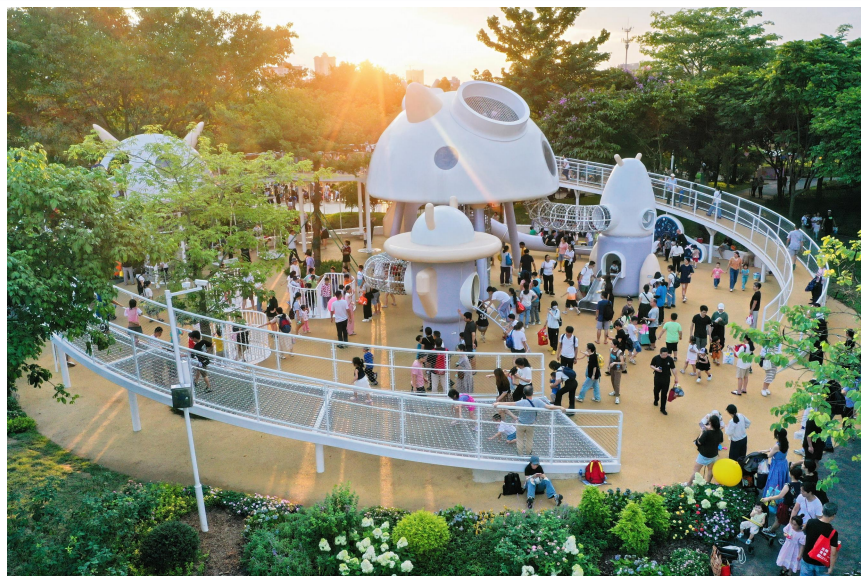
广州市儿童公园五羊号

为提升儿童福利和身心健康，促进儿童事业健康发展，根据国务院《中国儿童发展纲要》以及《广东省儿童发展规划》关于加大儿童活动设施建设，科学营造城市儿童友好空间等有关要求，2013年广州市政府启动广州市儿童公园建设，同步在各区部署12个区级儿童公园建设，打造“1+12”儿童公园体系。经过10年分期实施，逐步完善，该体系于2024年全面完成，为少年儿童构建了留住乡愁的友好成长空间和充满幸福感的童年。