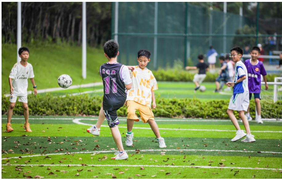
广州市儿童公园足球场

三是营造运动场地，强化科普体验。新建运动场地，可开展足球、篮球、网球、轮滑航模车模等少儿运动 10 余项，进一步激发儿童创造力和运动兴趣。打造航天、海洋、消防、交通、自然等为主题的沉浸式科普体验空间，构建集知识学习、实践探索于一体的开放型教育基地。